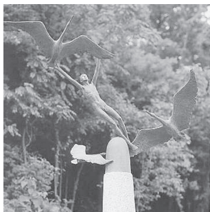
知北平和公園「彫刻の森」