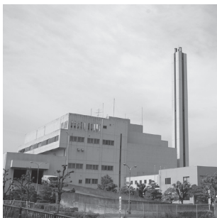
東部知多クリーンセンター