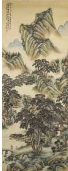
中川梅溪／新緑山水