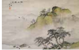
山本梅荘／仙山瑞靄