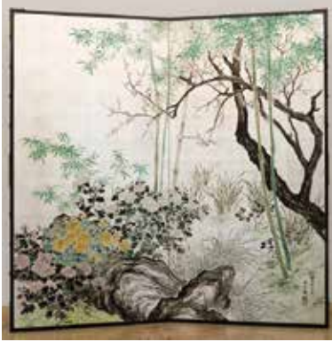
久野柳荘／四君子図屏風