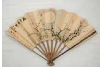
久野柳荘／扇子 知多市歴史民俗博物館所蔵