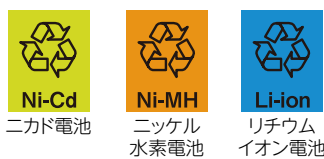
リサイクルマーク