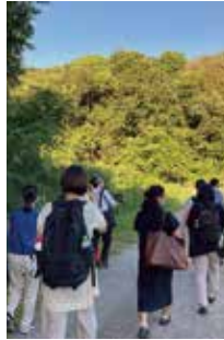
フィールドワークの様子