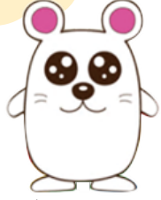
総合ボランティアセンター (なないろ) マスコットキャラクター (通称:なないろの妖精さん!?)