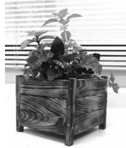
作品見本（植物はイメージ）

●整理券配布 8月14日 同午前9時～、参加者本人がこのはな館へ申込受付 8月14日 同午前9時30分～22日 同に参加者本人が問い合わせ先へ ※整理券をお持ちの方、窓口予約優先。電話申込可（留守番電話不可） ●このはな館（於大公園内） ☎（84）6166