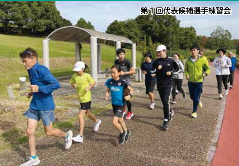
第11回代表候補選手練習会

12月2日(土)、愛・地球博記念公園で「第16回愛知県市町村対抗駅伝競走大会(通称:愛知駅伝)」が開催されます。