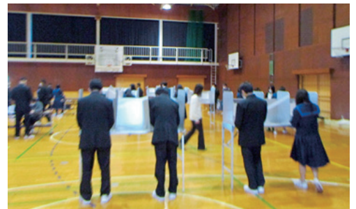
東浦高校での出前講座の様子

東浦町に限ったことではありませんが、近年若年層の投票率が低下状況にあります。そこで、町選挙管理委員会では、選挙の大切さを伝えようと、選挙出前講座を行っています。講座では実際の選挙機材を使い、本番さながらに模擬投票を行っています。