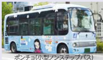
ポンチョ(小型ノンステップバス)

住民の皆さんからいただいた意見などを踏まえ、10月に町運行バス「う・ら・ら」のダイヤ改正を行います。