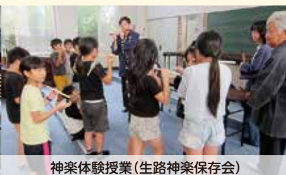
神楽体験授業(生路神楽保存会)