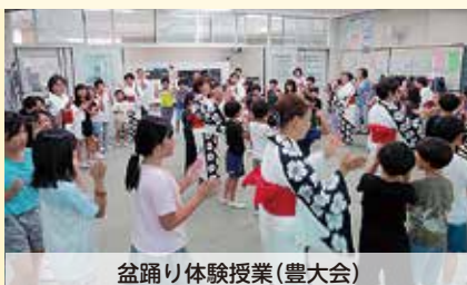
盆踊り体験授業(豊大会)