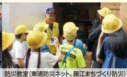
防災教室(東浦防災ネット、藤江まちづくり防災)