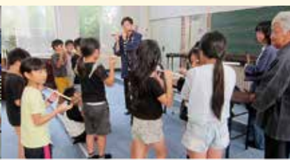
神楽体験授業(生路神楽保存会)