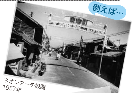
ネオンアーチ設置 1957年