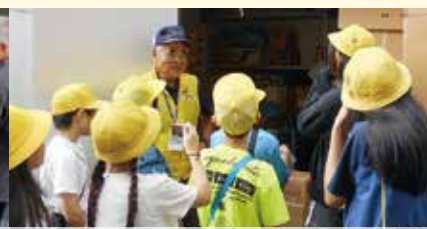
防災教室(東浦防災ネット、藤江まちづくり防災)