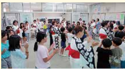
盆踊り体験授業(豊大会)