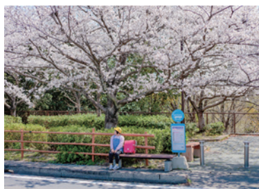
島村 桂祐 「東浦町於大公園バス乗り場」