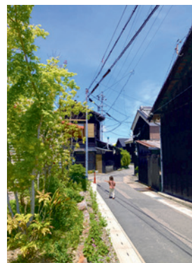
福島 英和 「生路の街並み」