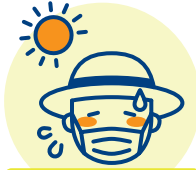
暑さ慣れしていない