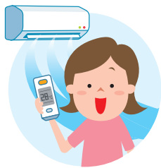
扇風機やエアコンで温度調節