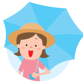
涼しい服装で帽子や日傘を利用