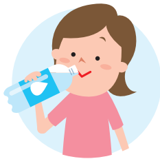
こまめに水分・塩分補給

外出時には、水分や塩分、冷却グッズの準備をしましょう。のどの渇きを感じていなくてもこまめに水分や塩分を補給し、一人ひとりの備えで熱中症を予防しましょう。