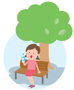
無理をせずに休憩を取る