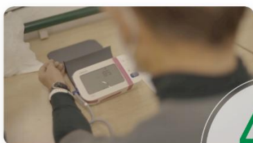
生活習慣病の管理

東浦町内在住で、2025 年 3 月 31 日時点で 59～79 歳の方のうち、2024 年度の特定健診・後期高齢者健診の結果から高血圧・高血糖などの一定の基準に該当した方