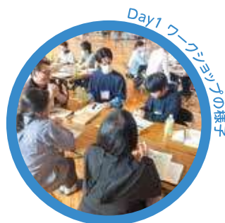
Day1 ワークショップの様子