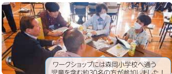
ワークショップには森岡小学校へ通う児童を含む約30名の方が参加しました!

森岡小学校へ通う児童の参加もあり、子どもから高齢者までの多世代から貴重な意見を聞くことができました。また、ワークショップの活動を通じて地区拠点の目指すべき姿が見えてきました。