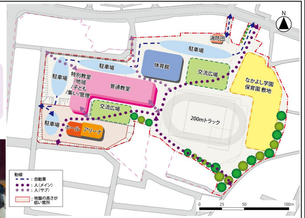
※記載の施設配置・道路・敷地は検討中のものであり、決定したものではありません

基本計画における配置図は、大まかな配置の方向性を示すものであり、今後設計段階で細かな調整をしていくことになります。